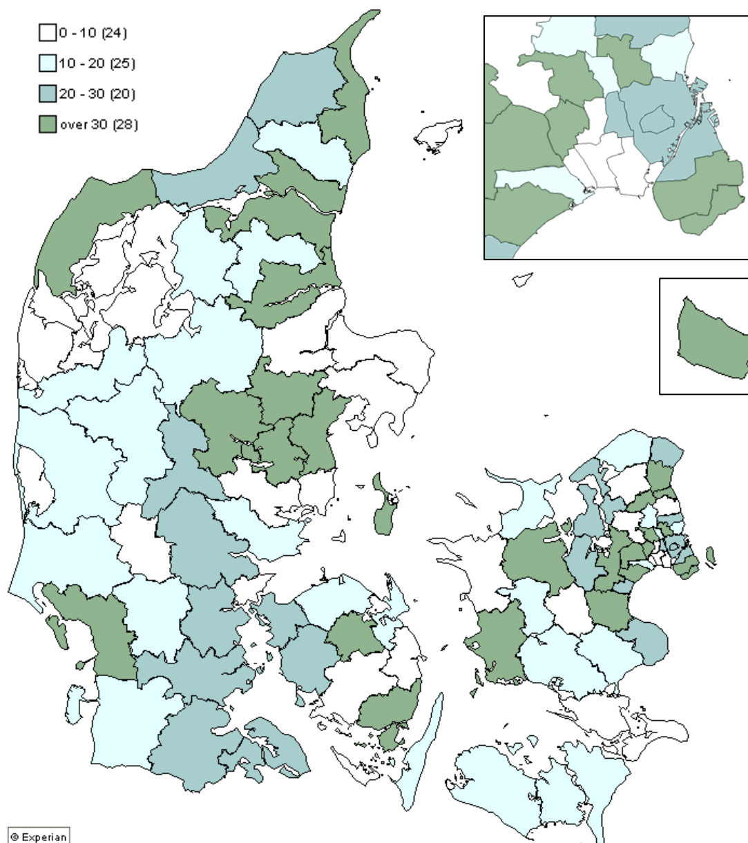
Figur 2. Andelen af elever med anden etnisk herkomst end dansk der modtager undervisning i dansk som andetsprog på kommuneniveau, pct.